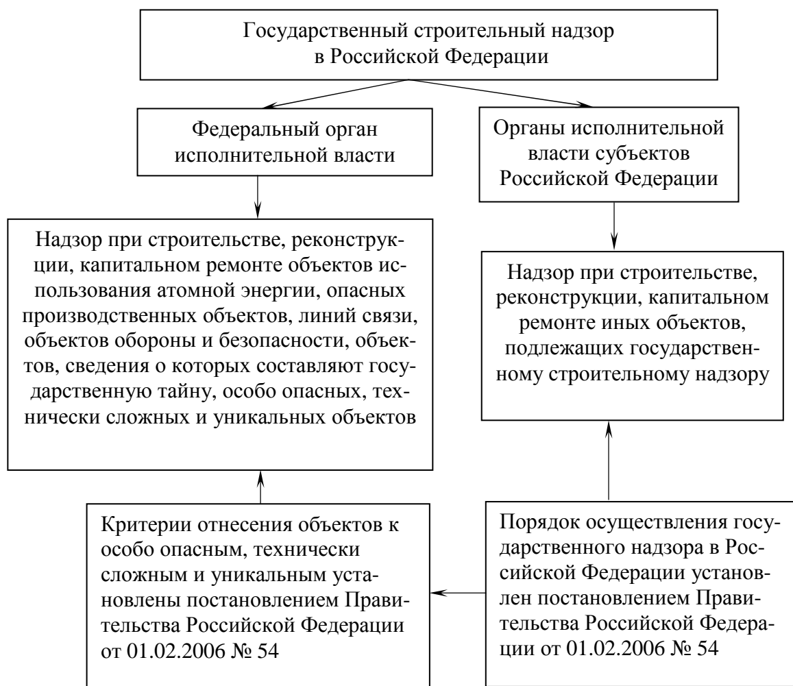
Рис. 2. Структура государственного строительного надзора

При выявлении в результате проведенной проверки нарушений должностным лицом органа государственного строительного надзора составляется акт, являющийся основанием для выдачи заказчику, застройщику или подрядчику (в зависимости от того, кто в соответствии с законодательством Российской Федерации несет ответственность за допущенные нарушения) предписания об устранении таких нарушений. В предписании указываются вид нарушения, ссылка на технический регламент (нормы и правила), иной нормативный правовой акт, проектную документацию, требования, которых нарушены, а также устанавливается срок устранения нарушений с учетом конструктивных и других особенностей объекта капитального строительства.