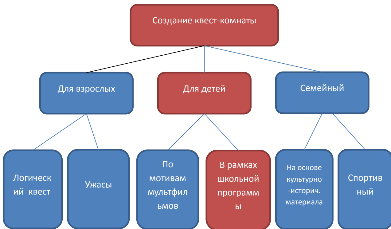
Рисунок 1 – Варианты принятия решения по организации квест-комнаты (цветом выделен наиболее приемлемый)