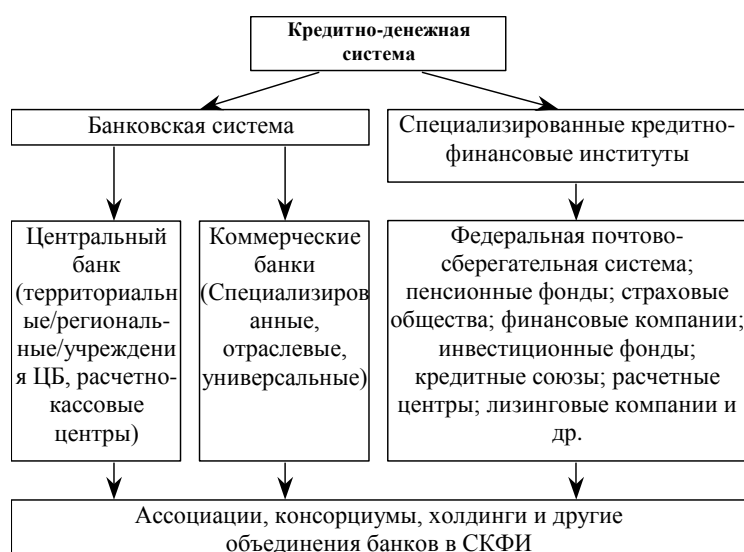
Схема 8.1. Структура кредитно-денежной системы

Структура кредитно-денежной системы представлена на схеме 8.1.