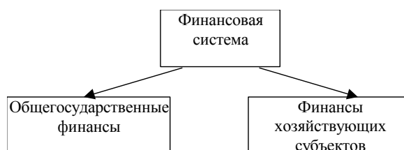
Схема 7.1. Структура финансовой системы

Финансы представляют собой экономический инструмент распределения и перераспределения валового внутреннего продукта, орудие контроля за образованием и использованием фондов денежных средств. Совокупность финансовых отношений в рамках национальной экономики образует финансовую систему государства. Ее структура показана на схеме 7.1.