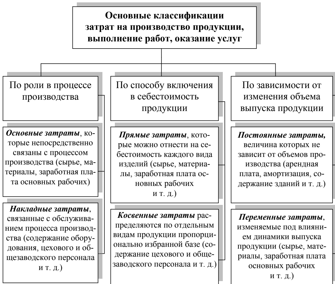
Рисунок 3.1 – Основные классификации затрат на производство продукции, выполнение работ, оказание услуг